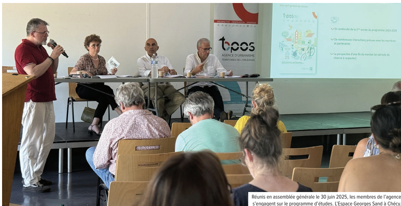
Réunis en assemblée générale le 30 juin 2025, les membres de l'agence s'engagent sur le programme d'études. L'Espace Georges Sand à Chécy.