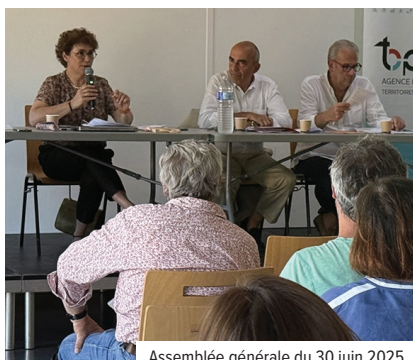
Assemblée générale du 30 juin 2025.